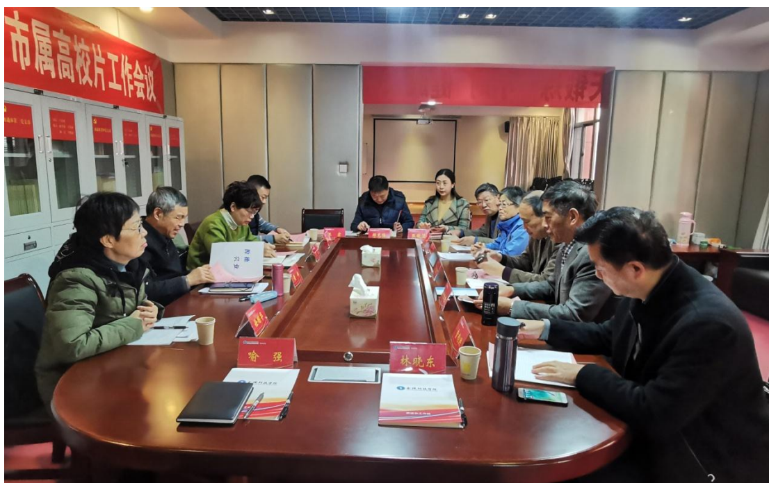
与会人员讨论交流